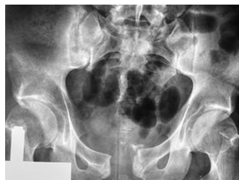
Zlomenina symfýzy typu otevřené knihy

Pacient je obvykle v šoku z masivního krvácení . Pokud je při vědomí, trápí ho bolest v sakrální krajině a podbřišku. Cílem klinického vyšetření je vypátrat nestabilitu pánve. Diagnóza se potvrzuje předozaďním , vchodovým a východovým snímkem při RTG vyšetření a CT vyšetřením.